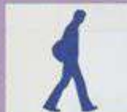
5 mins Walking Distant to College