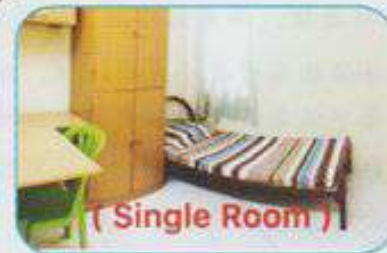
( Single Room )