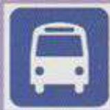
UTAR Bus (River Line)