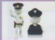
24 Hours Security service