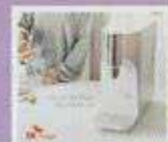
JIKSOO Hyper Water Purifier