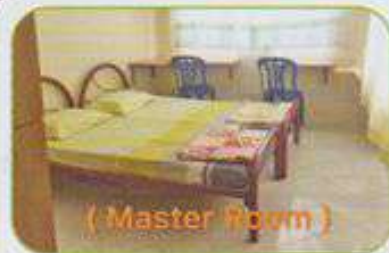
( Master Room )