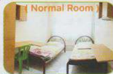
( Normal Room )