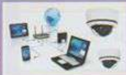
Internet Service & CCTV