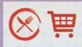
Nearly Food Courts / Hypermarket (Econsave)