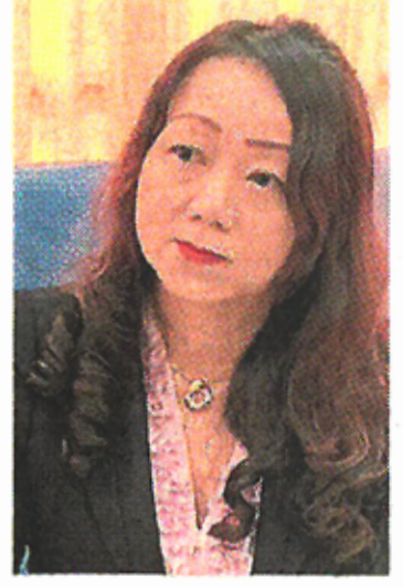
卓月圆:拉曼大 学学院首次推出新 生首学期分期付款 措施。