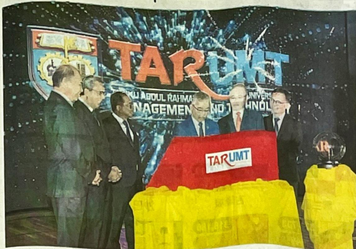
■苏丹阿都拉(右3)为拉曼理工大学推介后签名,左起为陈广才、廖中乘、卡立诺丁、魏家祥和李仕伟。