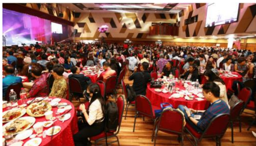
晚宴获得拉曼许多校友以及学生贷款基金捐助者的出席。