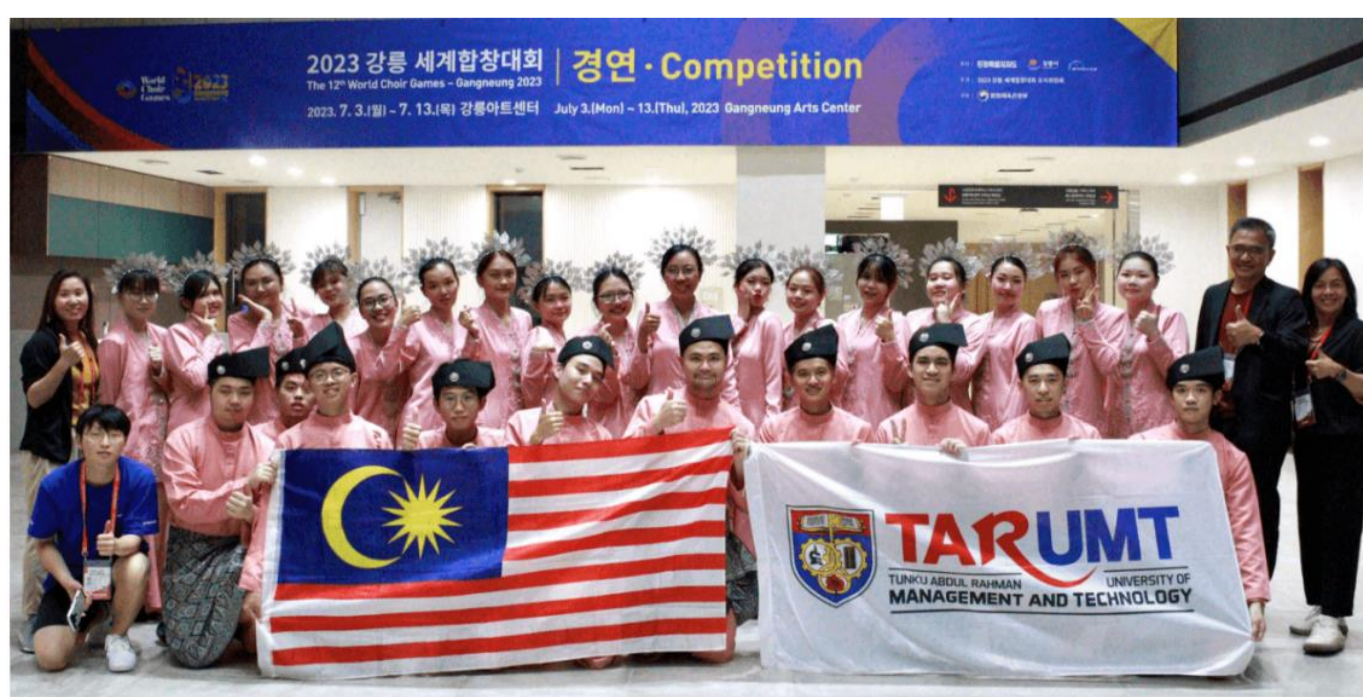
拉曼理工大学合唱团摄于韩国江陵市艺术中心。

拉曼理工大学合唱团对于拉曼社群、支持者和全球各地的粉丝给予的支持和激励深表感激。来自不同国籍观众的压倒性鼓励和友谊，让这支合唱团的韩国征战旅程留下深刻的美好回忆。展望未来，拉曼理工大学合唱团决心在这宝贵的经验基础上继续追求卓越，用和谐的旋律丰富世界，通过音乐的力量架起文化的桥梁。